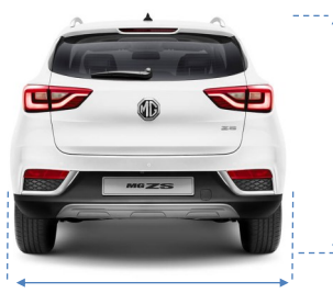
Ukupna širina 2.048 mm