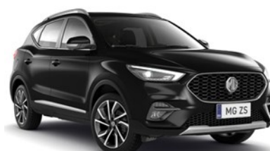
PEBBLE crna 500,00 €