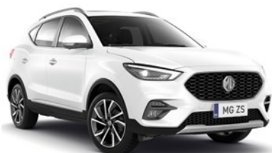
DOVER bijela BEZ NADOPLATE