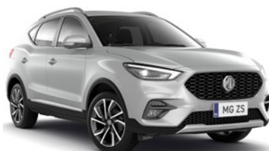
MONUMENT srebrna 500,00 €