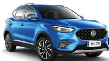
COMO plava 500,00 €