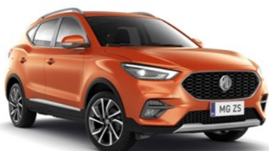
HOXTON narančasta 500,00 €