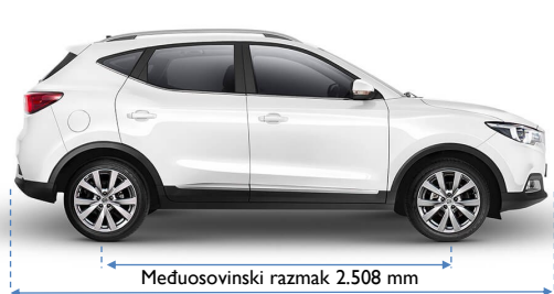
Ukupna duljina 4.323 mm