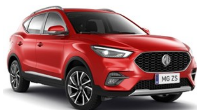
DIAMOND crvena 500,00 €